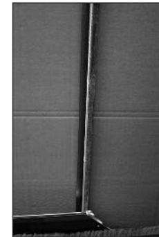
FU am Fensterrahmen anbringen.