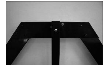
Stabilisator auf Blende befestigen (siehe Aufkleber Stabifuß)

➡ Aus Haftungsgründen werden keine Befestigungsmittel für den Rollladen zum Anschrauben auf den Untergrund mitgeliefert.