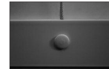
g Schnur durch Endstab führen und verknoten.