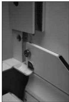
d FS auf Zapfen der Blendkappe (BK) aufstecken.