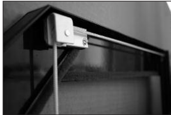
f Schnur durch Umlenkrolle am oberen Abschlusswinkel führen.