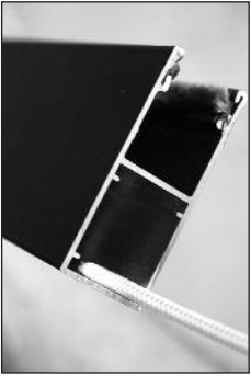
a Schnur durch Hohlkammer der Führungsschiene (FS) ziehen.