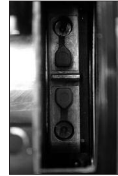
Probefahren und gegebenenfalls Anhaltepunkte neu einstellen.