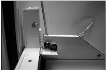
c Schnur durch Endstab führen und verknoten.