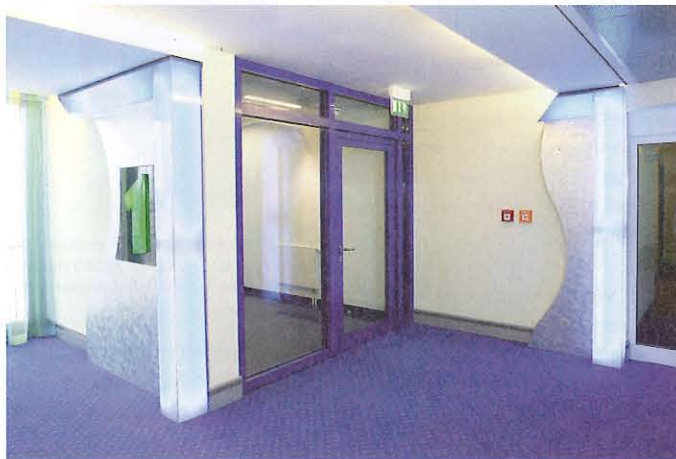
Ganz nach architektonischem Gestaltungsanspruch werden die Brandschutztüren wahlweise eloxiert, pulverbeschichtet, in Edelstahloptik oder endlackiert geliefert.