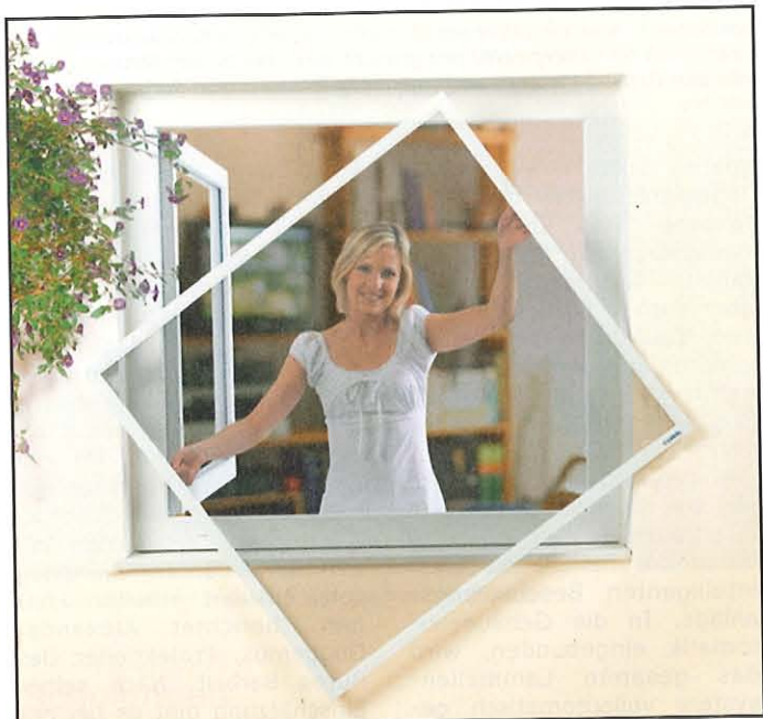
Maßgeschneiderte Lösung

im Programm. In wenigen Minuten eingebaut, bietet der Insektenschutz Sicherheit und ruhigen Schlaf bei offenem Fenster. Mit Lakal ist auch eine integrierte Lösung im Rollladenkasten möglich.